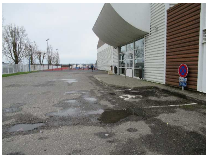
Parking PMR et cheminement